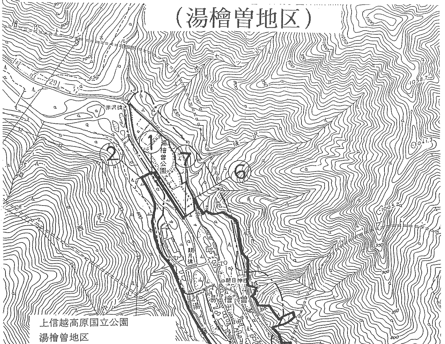
上信越高原国立公園 湯檜曾地区