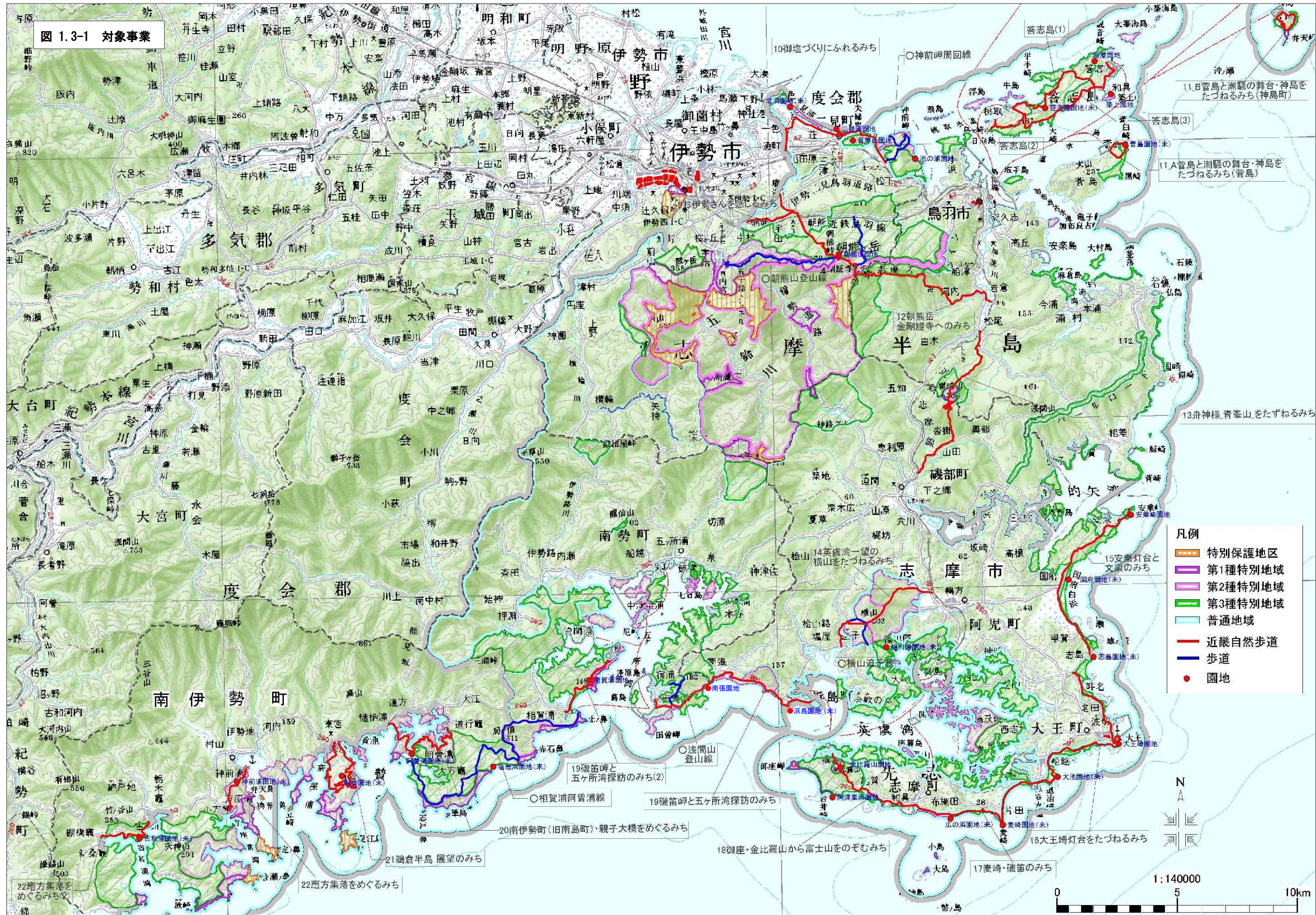
図 1.3-1 対象事業