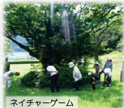
ネイチャーゲーム