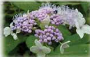
シロバナインナモリソウ