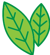
この植物どんな味?