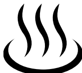
金太郎伝説の湯とは?