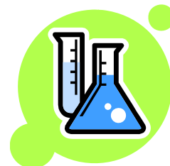
火と水でイオウの実験