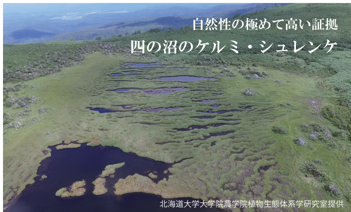
自然性の極めて高い証拠 四の沼のケルミ・シュレンケ

登山口から樹林帯を抜けて溶岩台地の上に出ると、背の低い変わった形をしたアカエゾマツが点在しています。これは吹きつける強い風の影響を受けて、幹や枝が風向きに沿うように風下側へ傾いたり曲がったりしたものです。厳しい環境の下でアカエゾマツは必死に生き続け、中には樹齢数百年を数えるものもあります。