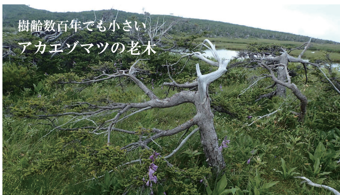
樹齢数百年でも小さい アカエゾマツの老木

日本で一番早い紅葉と言われる大雪山。針葉樹の緑と落葉、広葉樹の朱色や黄色など、微妙に異なる色が折り重なる中に、空の色を映す池塘が点在する様子は松仙園ならではの絶景です。運が良ければ初冠雪と紅葉を同時にみることができるかもしれません。