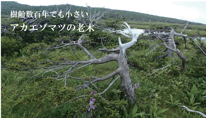
樹齢数百年でも小さい アカエゾマツの老木

日本で一番早い紅葉と言われる大雪山。針葉樹の緑と落葉、広葉樹の朱色や黄色など、微妙に異なる色が折り重なる中に、空の色を映す池塘が点在する様子は松仙園ならではの絶景です。運が良ければ初冠雪と紅葉を同時に見ることもできるかもしれません。