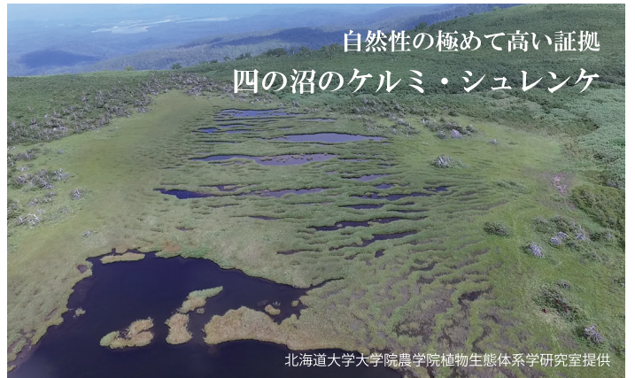
自然性の極めて高い証拠 四ノ沼のケルミ・シュレンケ

登山口から樹林帯を抜けて溶岩台地の上に出ると、背の低い変わった形をしたアカエゾマツが点在しています。これは吹きつける強い風の影響を受けて、幹や枝が風向きに沿うように風下側へ傾いたり曲がったりしたものです。厳しい環境の下でアカエゾマツは必死に生き続け、中には樹齢数百年を数えるものもあります。