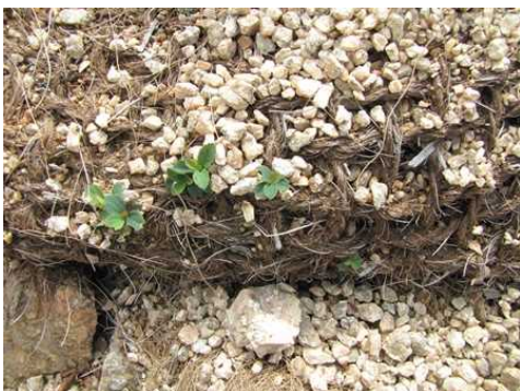
【ヤシ土嚢への植物の侵入状況】