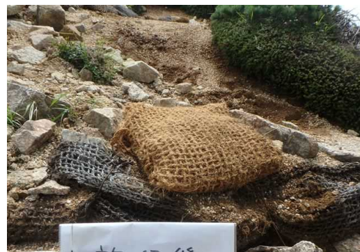
【1班 ヤシ繊維を混ぜた土嚢の設置】