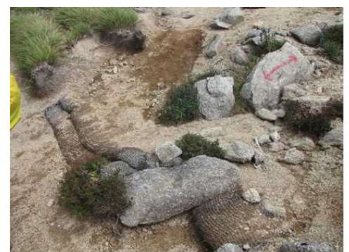
【砂防ダムの効果により土砂が堆積】