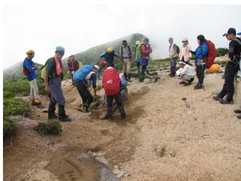
【ふりかえりの様子】