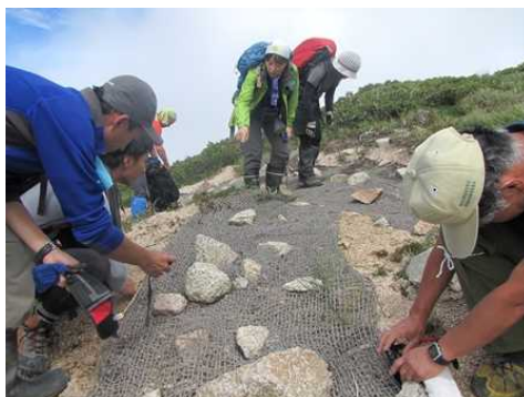
【ヤシネットへの植物の侵入状況を観察】