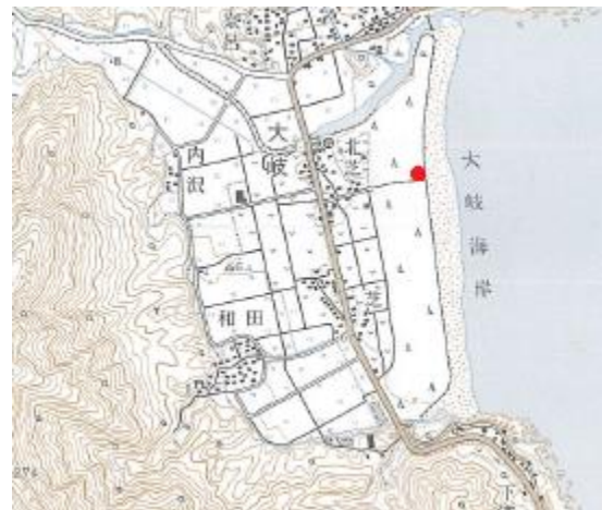
②大岐海岸園地遊歩道脇