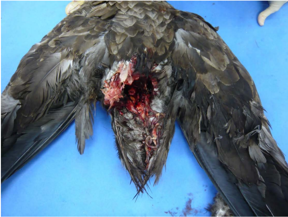
図 3 . 腰部における離断面