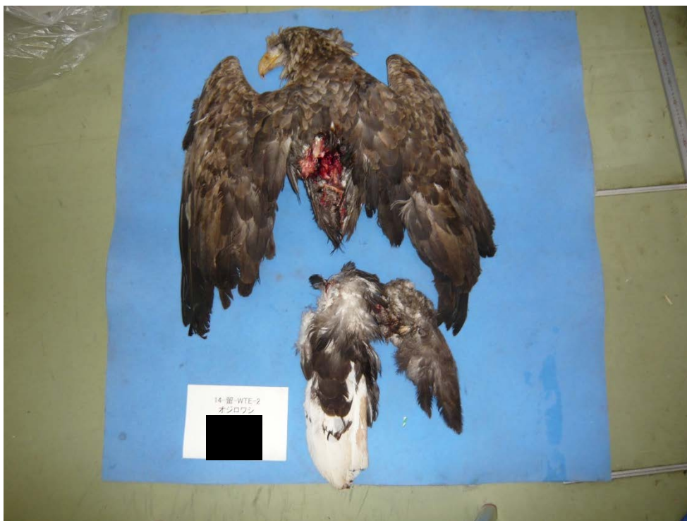
図2 . 背側像