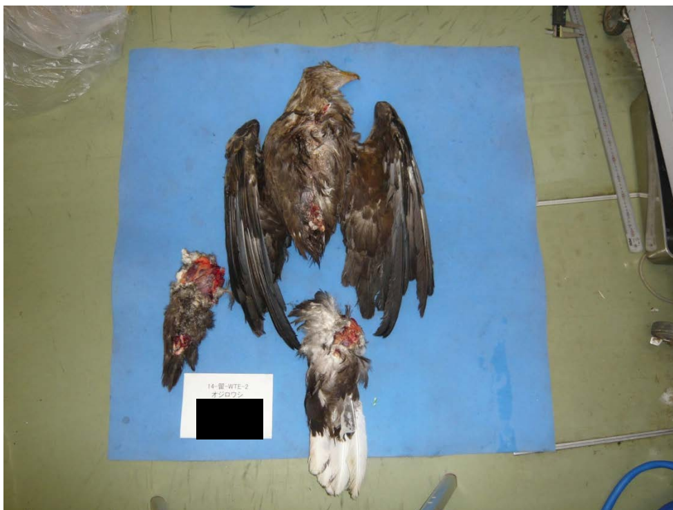
図1 . 腹側像