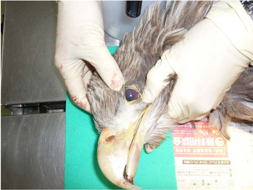
図5. 眼球内に認められた重度の出血