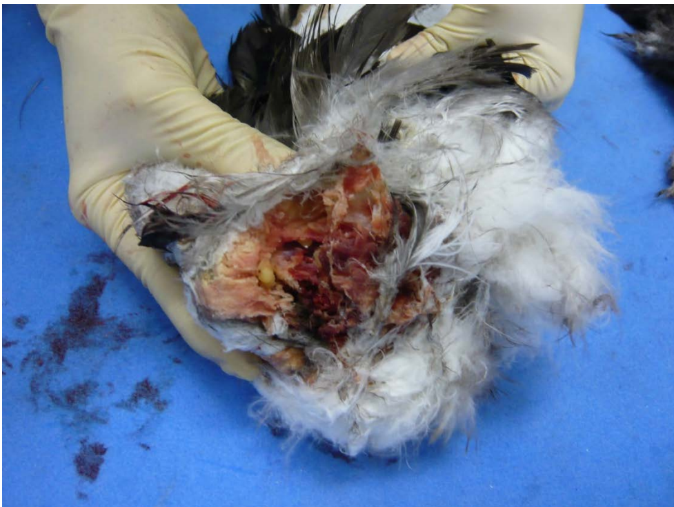
図6. 尾椎の断面 尾椎は粉碎している