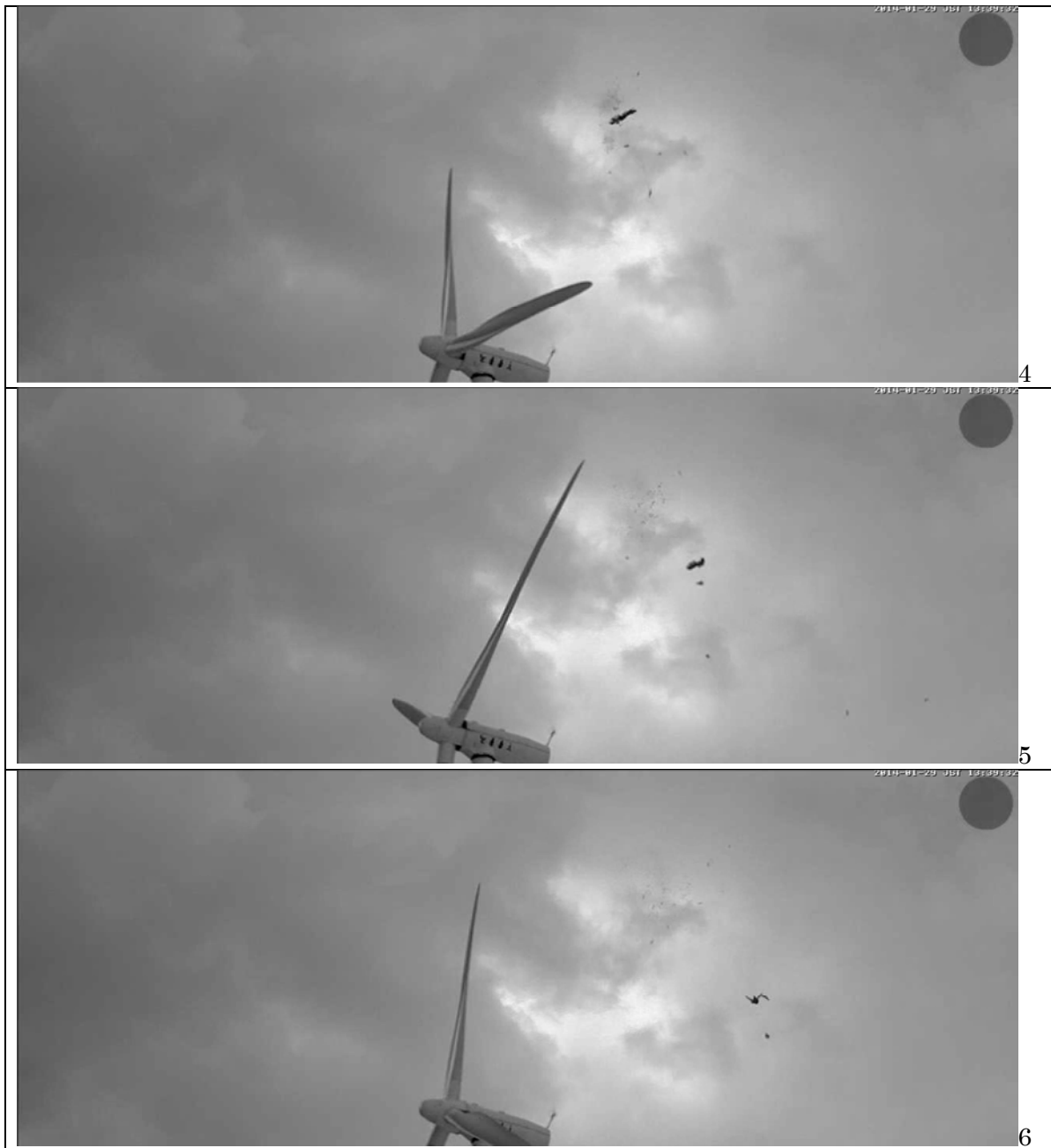
図 3-2- 10 海ワシ類の衝突連続画像(4~6) (平成 26 年 1 月 29 日、苫前側カメラによる拡大画像)