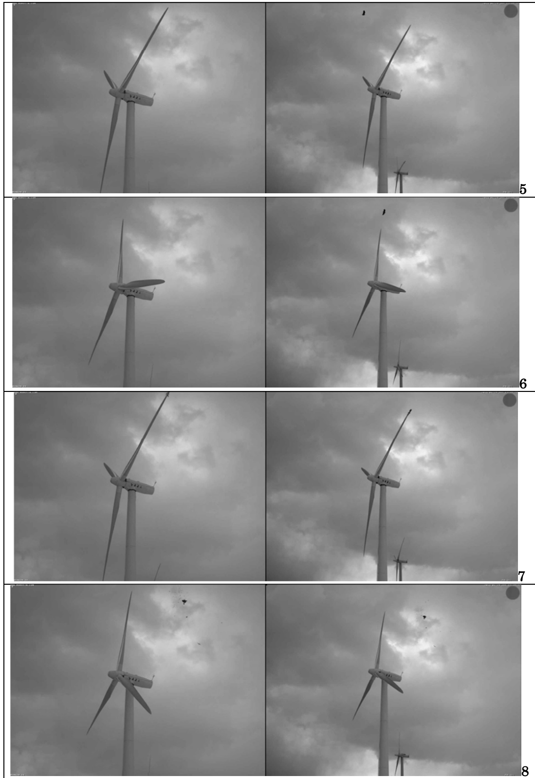
図 3-2- 6 海ワシ類の衝突連続画像(5~7)

(平成 26 年 1 月 29 日、苫前側カメラによる全景。左 : 40 度レンズ、右 : 55 度レンズ)