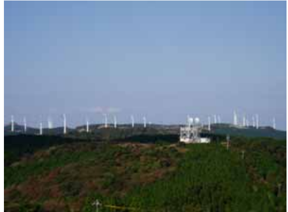
三角点からの遠望