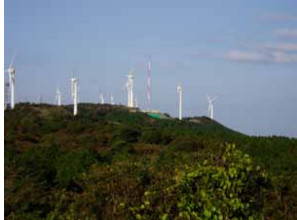
第6駐車場からの展望