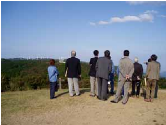
三角点からの視察風景