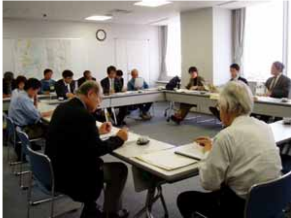
三重県より概要説明