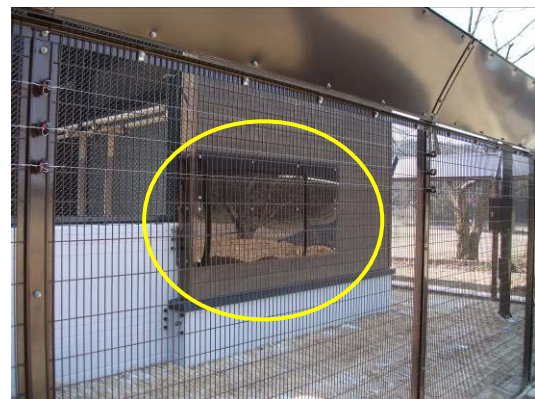
繁殖ケージ東側外壁