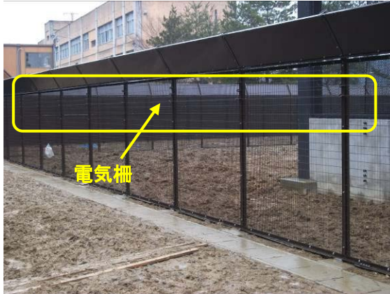
飼育ケージ外周フェンス