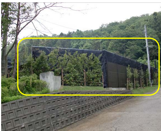
市道からの進入路側