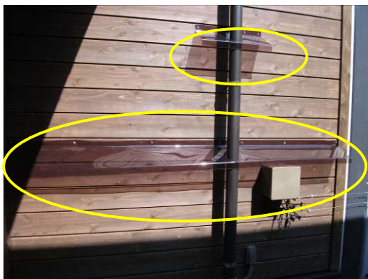
後期育雛室西側外壁