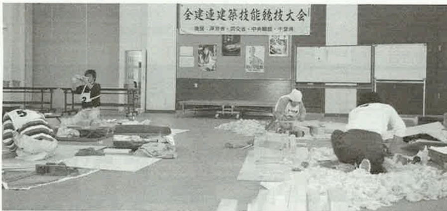
全建連建築技能競技大会