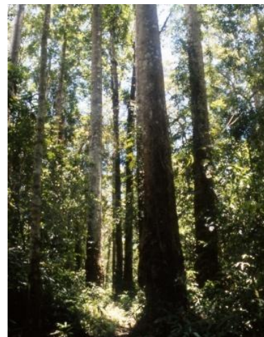
写真2 ダマール採取林