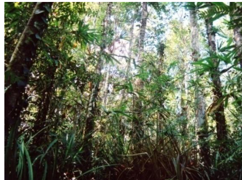
写真1 フォレストガーデン

一方、ダマール採取林は、自生する実生や幼木を人が選択的に保護した結果形成された、マニラコパールノキの優占林である。これも広大な天然林のなかに点在している。この樹木から採れる樹脂(kopal)は、1920年代ごろから1960年半ばごろまで、村の重要な現金収入源であった。市価がつかなくなっても、夜、灯