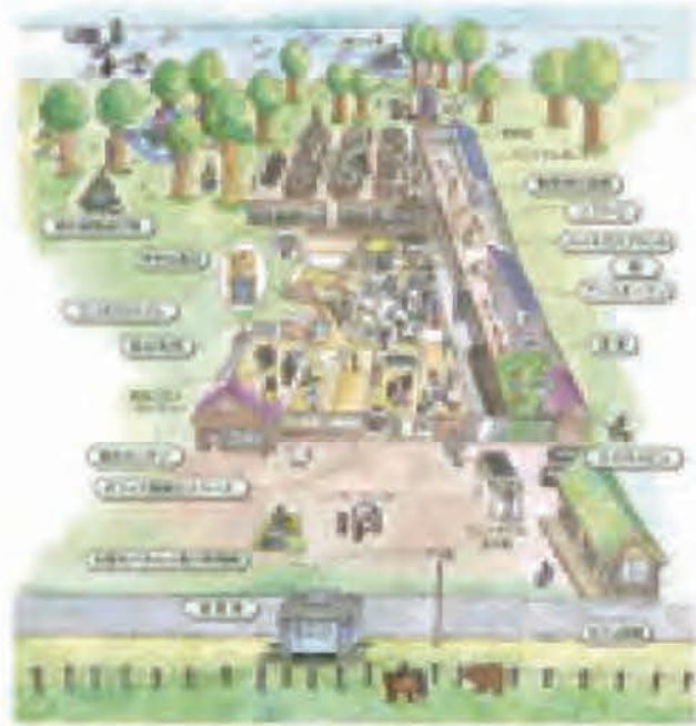
森と風のがっこうの施設

「森と風のがっこう」の拠点は、新しいものを作るのではなく、足元にある資源を活用するという考えから、廃校となった小学校の施設を利用して整備された。その内容は空き缶風呂やコンポストトイレ、バイオガス装置といったエネルギー利用施設や、子どもの遊び場、農場、カフェなど、多岐にわたっている。地域にある未利用資源などを活用することを方針とし、ボランティアや専門化など多様な人々と協力しながら整備してきた。これらの設備が複合的に機能し、循環型の暮らし体験の場、子どもの居場所、地域との交流の場といった役割を果たしている。