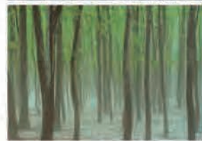
越後妻有地域の景観 (上:星峠の棚田、下:美人林(ブナ林))