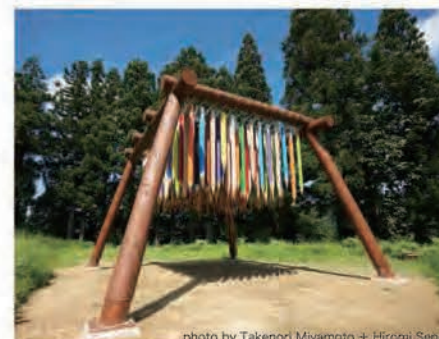
設置された作品の数々

また、地域住民の間で、アーティストや都市からの来訪者とのコミュニケーションを通じて、芸術祭の舞台である地域の景観や生活文化の素晴らしさが再認識されてきている。