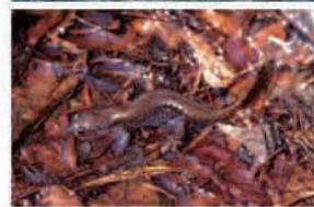
呉羽丘陵の景観 (上:呉羽丘陵の全景、 下:絶滅危惧種のホクリクサンショウウオ)