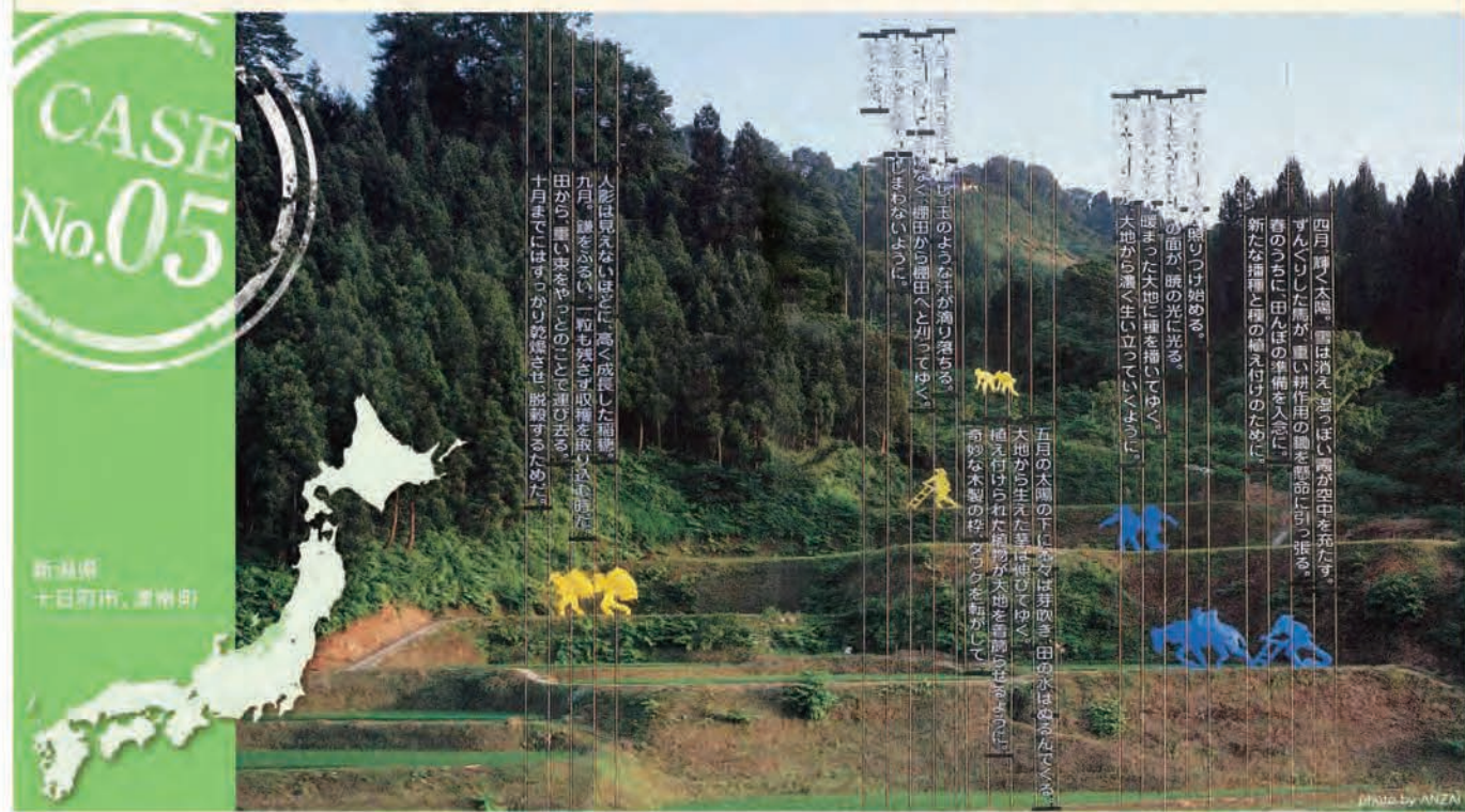
supported by Benesse Corporation