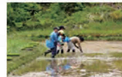
棚田バンク参加者による作業の様子

また、地域産品振興の取組として、「Rooots 越後妻有の名産品リデザインプロジェクト」が始まっている。これは、地域産品と全国の若手クリエイターのマッチングを行い、新しいパッケージを生み出す取組である。これまで米や日本酒、菓子など約30点が実現し、地域産品の売上増加に貢献している。また、「2010年度グッドデザイン賞・パブリックコミュニケーション部門」など数々の賞を受賞している。