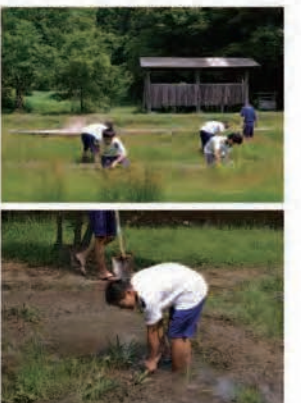
ビオトープにおける活動の様子 (上:草刈、下:泥遊び)

活動の内容によっては地域の様々な人たちと協力して活動を行っている。また、子どもたち自らが毎週「宍中村だより」を発行し、保護者や地域の方に活動報告をしている。