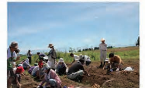
じゃがいも掘り体験の様子