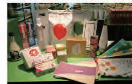
リデザインプロジェクトにより生み出されたパッケージ