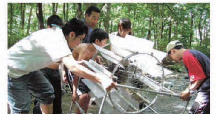
がっこう裏の川で水車をまわす子どもたち

「森と風のがっこう」は標高700m、12世帯の集落にある廃校を再利用したエコスクールである。2001年、葛巻町の協力を得て岩手子ども環境研究所が開校した。自然エネルギーや足元にある資源を活かした循環型の生活が、楽しみながら子どもも大人も体験できる場をつくり出してきた。北欧のライフスタイルと地場の暮らしにまなびながら過去と未来をつなぐ新たな道を模索し、地元の子どもの居場所づくり、長期自然エネルギー体験スクールなどを実施している。自然資源を取り入れた循環型のライフスタイルを子どもから大人まで体験を通して楽しみながら学びあう多様な活動を進めてきたことが特徴で、来訪者や地域住民が交流する場にもなっている。