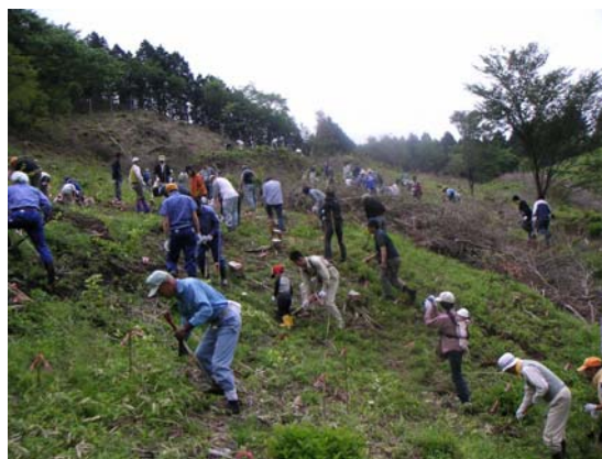
キリンビール・小田急電鉄による里山整備の状況