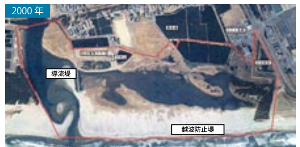
2000年 事業対象地域。1975年時に比べ干潟の露出面積の減少がみられる。