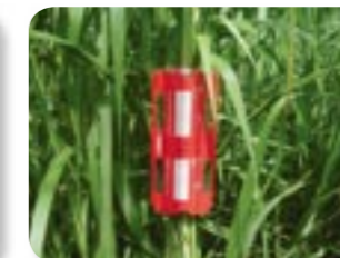
新たに開発したアノール捕獲用粘着トラップ