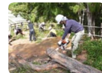
地元ボランティアによる外来植物駆除作業