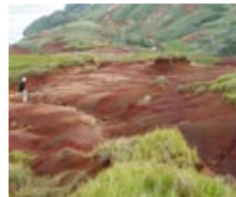
ノヤギの食害や踏圧により植生が消え赤土が流失