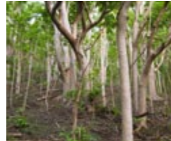
外来植物（アカギ）が繁茂して生物多様性が低下した森林