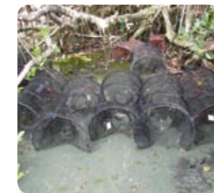
ウシガエル捕獲トラップ