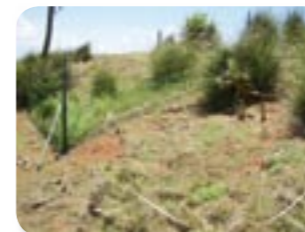
ノヤギ侵入防止柵で囲った植生回復試験区（弟島）

小笠原諸島では、ノヤギの食害と踏圧による植生破壊や、グリーンアノールによる希少昆虫の捕食などによって、島しょ生態系に大きな影響が現れています。このため、これら外来種の生態等を調査し、効果的な防除手法や失われた自然を再生するための手法の検討や実証試験を行っています。