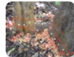
アカギの薬剤枯殺（薬剤の染み込んだコルクを根元に打ち込む）

実証試験で得た知見をもとに、母島北部では在来植生を駆逐するアカギの薬剤枯殺による広域駆除、弟島ではノブタ、ウシガエルの島内根絶に向けた駆除を実施しています。