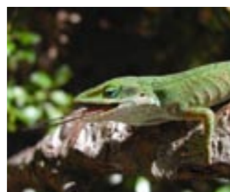
希少昆虫を捕食するグリーンアノール