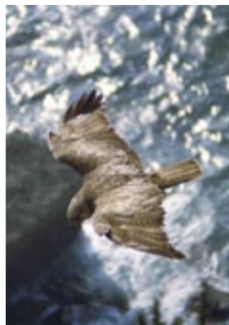
オガサワラノスリ