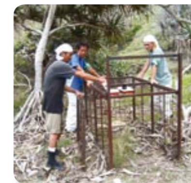
ノブタ捕獲用の箱罠