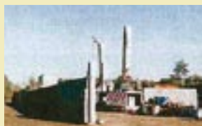
廃棄物処理場を撤去し実生移植を実施 (3年後)