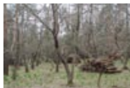
雑木林再生モデル事業