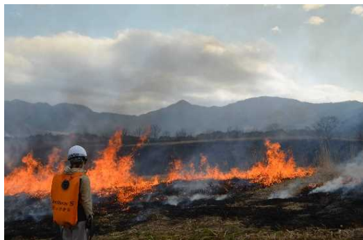
山焼き（火入れ）の様子