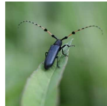
フサヒゲリカミキリ