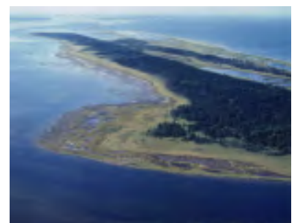
上空から見た春国岱