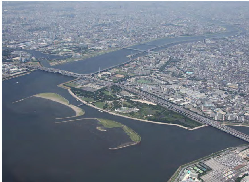
南東上空から見た葛西海浜公園