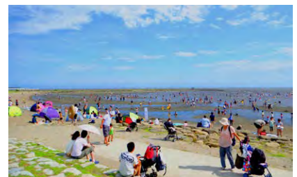
西なぎさで遊ぶ人々

もの、野鳥及び魚類の観察会、海苔すき体験、海水浴体験、釣りなど様々なレクリエーションを楽しむことができる。