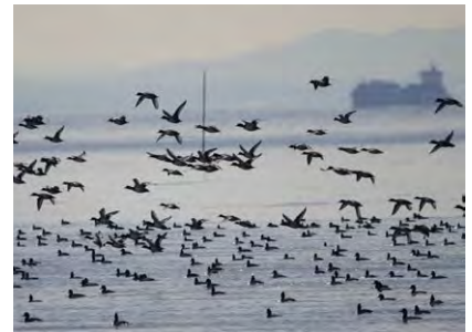
乱舞するスズガモ(冬)

葛西海浜公園は都心から公共交通機関を利用してのアクセスがよく、多くの人々が海の自然に触れ、海の魅力を体感する場となっている。西なぎさでは、干潟の生き