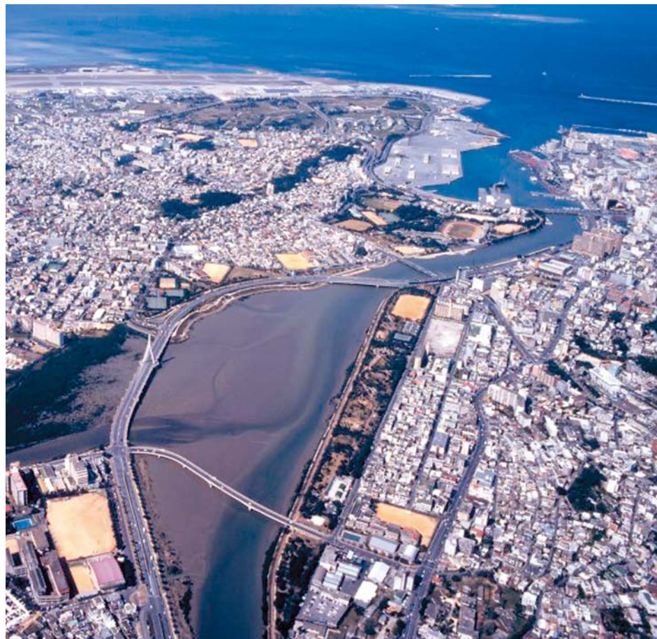
東上空から見た漫湖