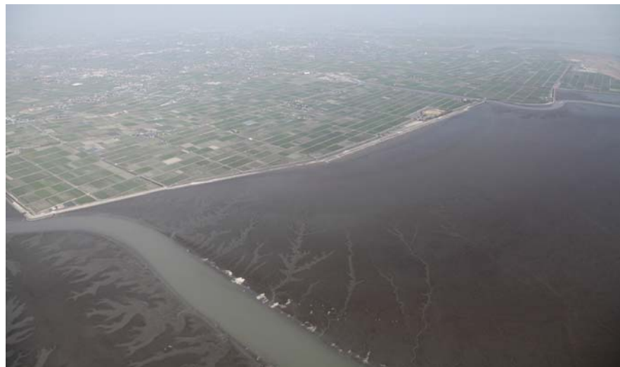
南西からみた東よか干潟全景