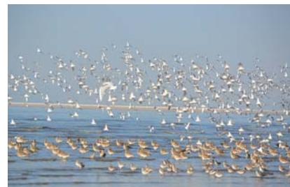
シギ・チドリ類の重要な中継地