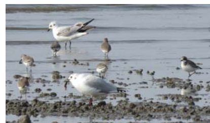
ズグロカモメ

とその後方に広がる干潟が一望でき、また、海岸線沿いの遊歩道からは、引き潮のときには無数のカニやムツゴロウ、トビハゼなどが観察できる。春・秋の渡りの時期に、数千羽のシギやチドリが干潟めがけて飛んできて、一心不乱に餌をついばむ姿は壮観である。