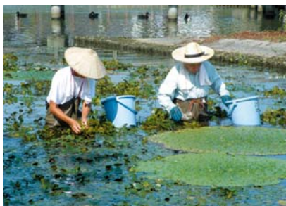
ヒシの実の採取風景