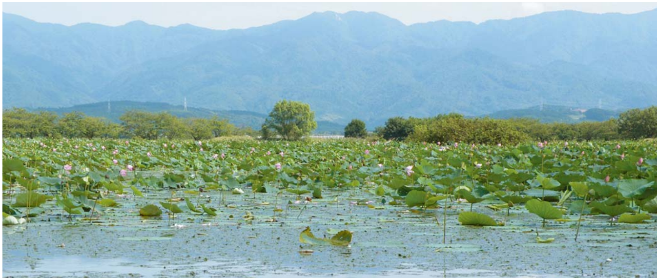
ハスの花咲く夏の瓢湖