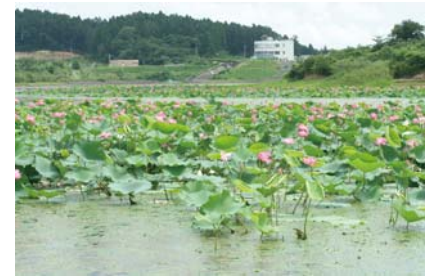
西側からの景観(中央奥にダム管理事務所)