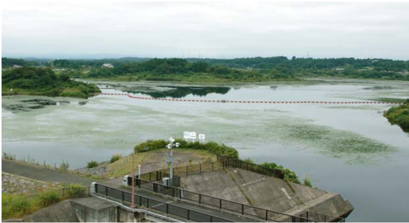
南東から見た沼の全景