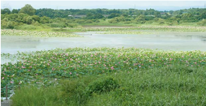
南側から見た夏の化女沼