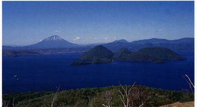
しこつこうや 支笏洞爺国立公園