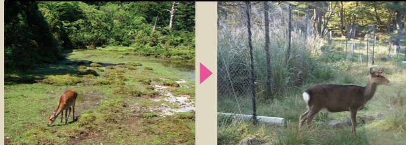
シカによる荒廃（食害）を防止するために防鹿柵を整備