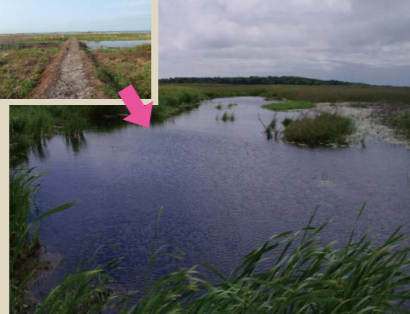
利尻礼文サロベツ国立公園 (水路の堰き止め堤防整備により復活した落水沼)