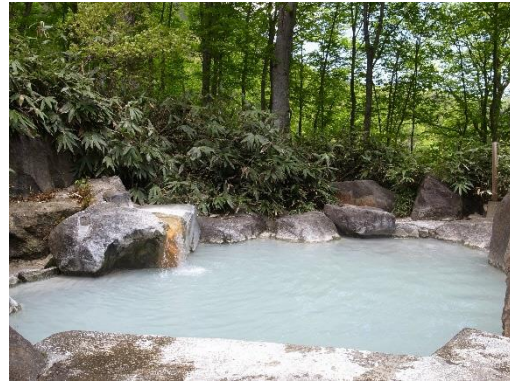
燕温泉野天風呂「黄金の湯」