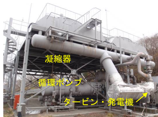
バイナリー方式による発電システム