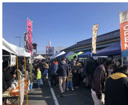
ゆのごうマルシェ