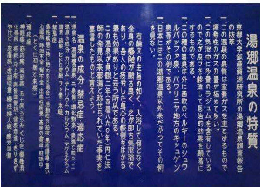
医治効用を示す看板

その医治効用は、大正 3 年に内務省が行った試験で証明されている。また、昭和 25 年に京都大学の上治教授によって行われた調査では、湯郷温泉の気泡を含んだ泉質は、長時間の入浴に適しており、このような泉質は世界的にも珍しいと報告されている。