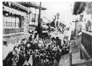
昭和の頃の湯郷温泉

京阪神からのアクセスの良さから、昔日は団体旅行受入型の歓楽街として賑わいをみせていたが、時代の流れとともに衰退傾向にある。