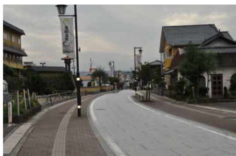
無電柱化・景観舗装