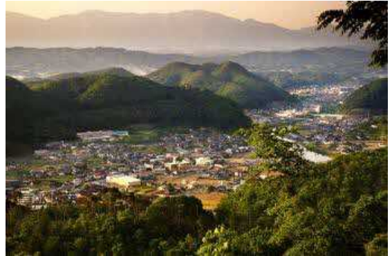
大山展望台から臨む湯郷温泉

湯郷温泉の歴史は古く、奈良時代には塩湯郷の地名で知られており、開湯は 1200 年以上の昔、平安時代、延暦寺の慈覚大師 円仁法師が、湯郷の地で水浴びをして傷を治す鷲を発見したという逸話から始まる。百人一首の選者である藤原定家も療養のために湯郷温泉を訪れたかったが、「遠方の為有馬温泉で我慢をするか」と書いている。開湯の逸話からもわかるように、湯郷温泉は療養泉であり、江戸末期には湯治客で賑わっており、湯郷村の 80 軒のうち 76 軒が湯治関連を生業としていた。