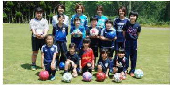
岡山湯郷 Belle によるサッカースクール

安全な環境については、湯郷温泉は災害が少ない土地であるが、非常時に備えた防災計画を策定していく。町づくりの面からは歩行者に快適な空間を作るため交通安全対策等の取組を行うとともに、遠方からの利用客にとって重要なアクセシビリティ・利便性向上のために、中国縦貫自動車道や供用中の美作岡山道路一部区間の利用に加え、更なる広域ネットワークの強化に向け、岡山県と連携しながら未供用の湯郷温泉 IC～吉井 IC 間の早期供用を目指し、湯郷温泉の公共的利用の増進を図る。