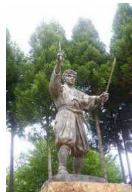
青年期宮本武蔵像