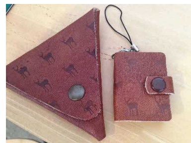
鹿革クラフト体験

工芸についても、有害鳥獣の地域資源への活用として鹿革を使ったクラフト体験など、多様な体験工房が楽しめる体制が整っている。