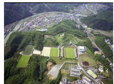
美作市総合運動公園

湯郷温泉において泉質と同様に特筆すべきなのは、スポーツとの関わりである。湯郷温泉を有する美作市内には女子サッカー日本代表を輩出した岡山湯郷 Belle を始め、世界的な知名度を持つ宮本武蔵の生誕地としてその名を冠した武蔵武道館、F1 も開催された岡山国際サ