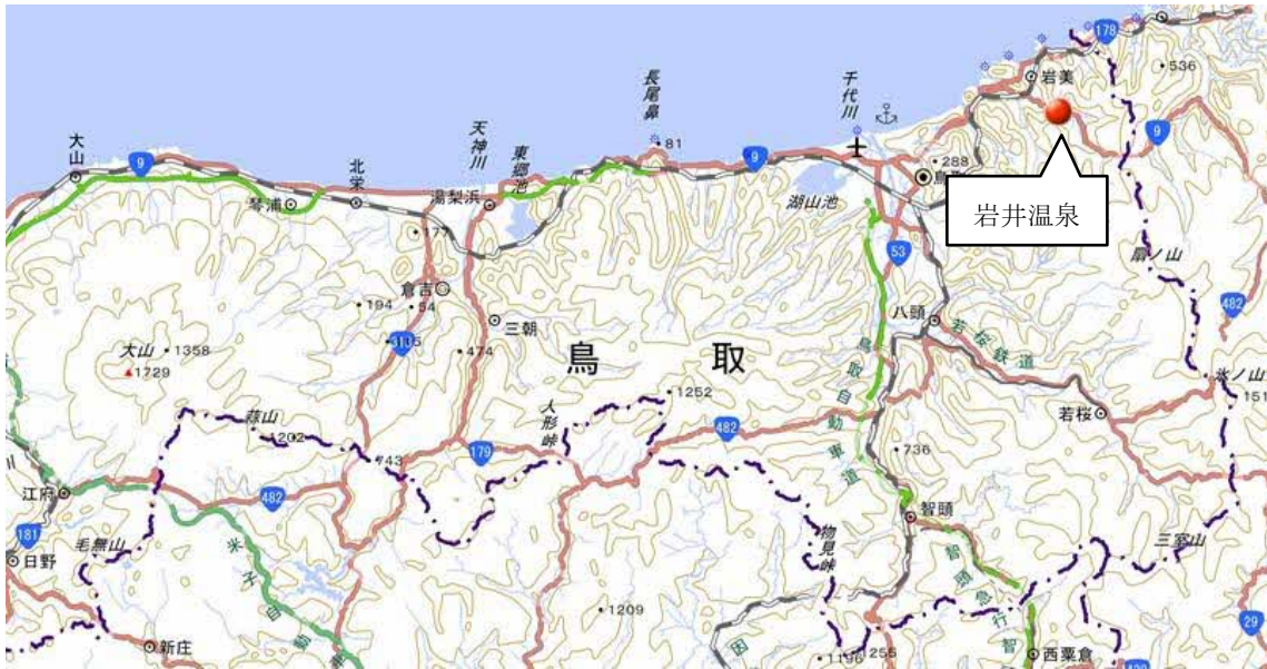
国民保養温泉地位置図