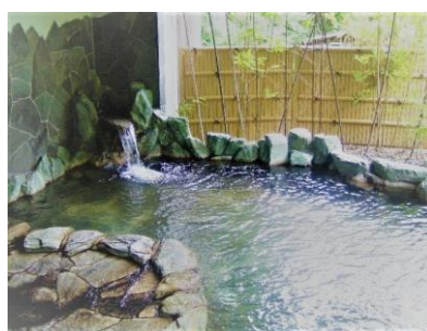
▲龍神温泉露天風呂

また、江戸時代には紀伊国を統治した紀州藩とも関わりが深く、藩主が湯治を行うために、初代藩主徳川頼宣が「上御殿」「下御殿」を作らせた。現在、「上御殿」「下御殿」は旅館となり、「上御殿」の建物は国の登録有形文化財に指定されている。