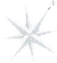
龍神温泉郷保養温泉地位置図