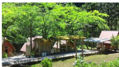
▲バンガロー&キャンプ場