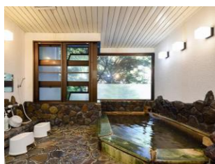
▲龍神小又川温泉引湯施設

小又川温泉地区は、龍神温泉から500m下流に位置し、昭和52年に温泉が開発された比較的新しい地区である。文久3年8月尊王倒幕の念に燃える勤王の志士8名が幽閉されたと伝えられる天誅倉（県史跡指定）など史蹟と伝統に彩られた日高川の支流、小又川のほとりに位置する。地区内にはバンガローやキャンプ場をはじめ、温泉については近隣の宿泊施設へ引湯しており、小グループや家族連れの保養の場として適しており、緑豊かな環境とともに脚光をあびている。