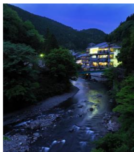
▲夕刻の龍神温泉景観