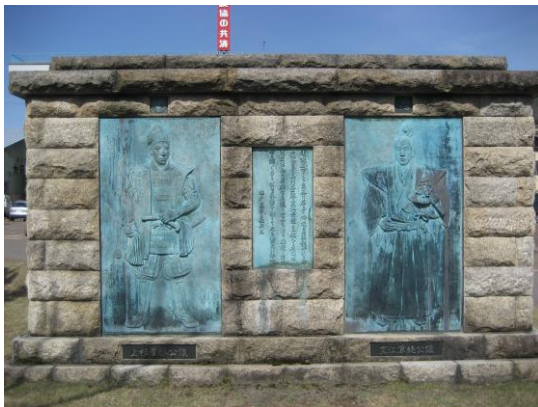
▲上杉景勝、直江兼統レリーフ

また、豪雪地である南魚沼地域で受け継がれてきた文化に織物がある。その昔、一年の半分近くを雪に覆われ、農作業はもちろん、家の外に出るのにも苦勞するほどの雪に囲まれたなか、女性たちは春が来るまでひたすら布を織り続けたという様子が江戸時代の文人・鈴木牧之の著『北越雪譜』に記載されている。そのなかでも、通気性に富み、さらりとした着味で夏物着尺としては最高級の麻織物である「越後上布」は染織部門では日本で初めてユネスコ無形文化遺産に登録され、日本のみならず世界から評価されることとなった。