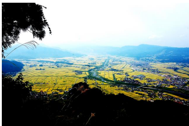
▲夏の南魚沼の田園風景

六日町温泉は坂戸城（坂戸山）の麓に位置することもあり、多くの観光客に温泉にも親しんでもらっている。坂戸山は以前から地元民の朝晩の登山やトレッキングに親しまれていたが、近年では全国から登山客が訪れている。登山後の温泉利用を促進し、更に温泉の魅力を少しでも伝えようと温泉街周辺に無料の足湯を2か所設置し、坂戸山遊歩道の整備、公衆トイレの整備、上田長尾氏史跡公園整備を実施してきた。六日町温泉は、六日町の観光資源とともに成長を遂げてきた。