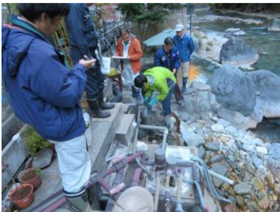
源泉調査の様子(平成30年11月)