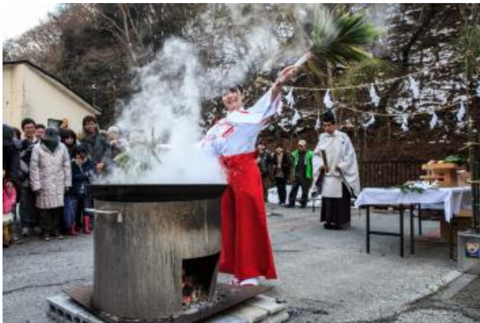
1月の大寒に行われる湯立祭の様子