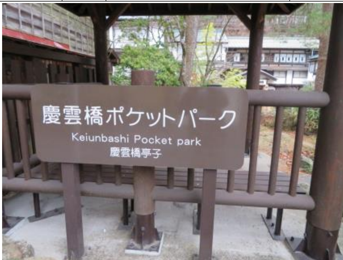
平成27年度に設置をした3ヶ国語表示(英語・中国語・日本語)の案内看板