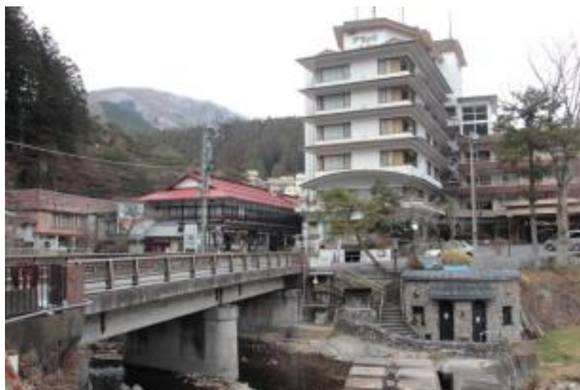
木造の建物（左）とホテル（右上）と共同浴場（右下）

現在、宿泊施設として32施設、地域の共同浴場として、「河原の湯」・「御夢想の湯」・「上の湯」の3施設、日帰り入浴施設として、「四万清流の湯」の1施設がある。