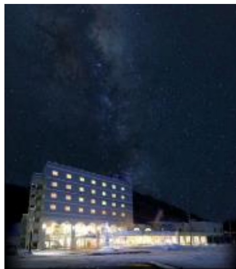
スターライトホテル

また、自然災害の極めて少ない快適な生活環境であり、気候は大陸性で年間平均気温は 7.7 と比較的温暖な方であるものの、降雪量は多く年間降雪量は約 5 m、最深積雪は 1 mを超える。