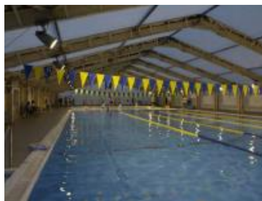
B & G海洋センター