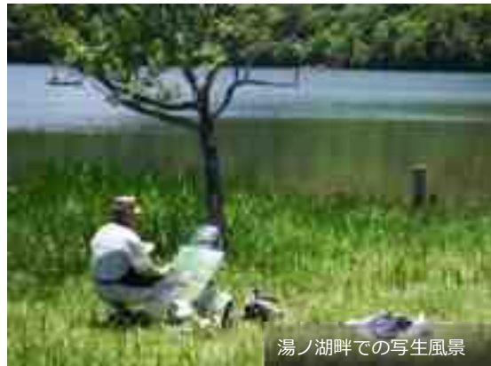
湯ノ湖畔での写生風景