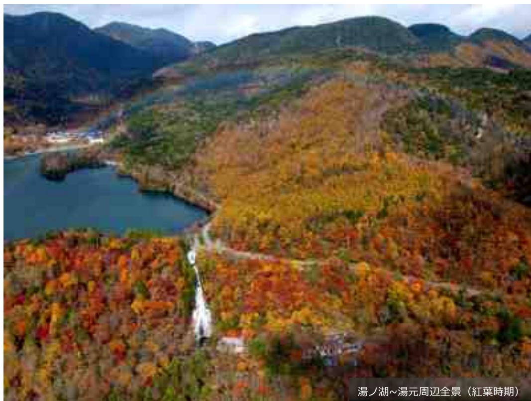
湯ノ湖～湯元周辺全景（紅葉時期）