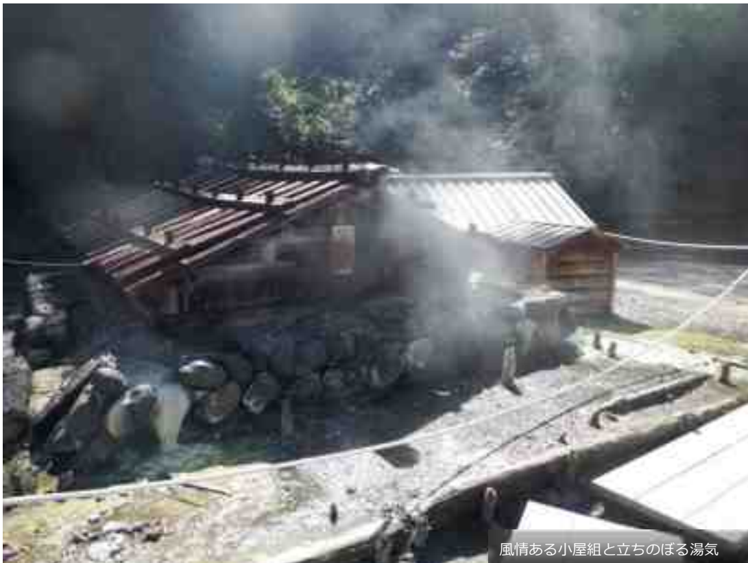
風情ある小屋組と立ちのぼる湯気

したがって、こうした変化を的確に把握するため、栃木県と日光市、源泉所有者が協力し、(2)の取組を継続して行うものとし、万が一、泉温や泉質に変化が生じた場合は追加調査を実施するなどの措置を講じるものとする。