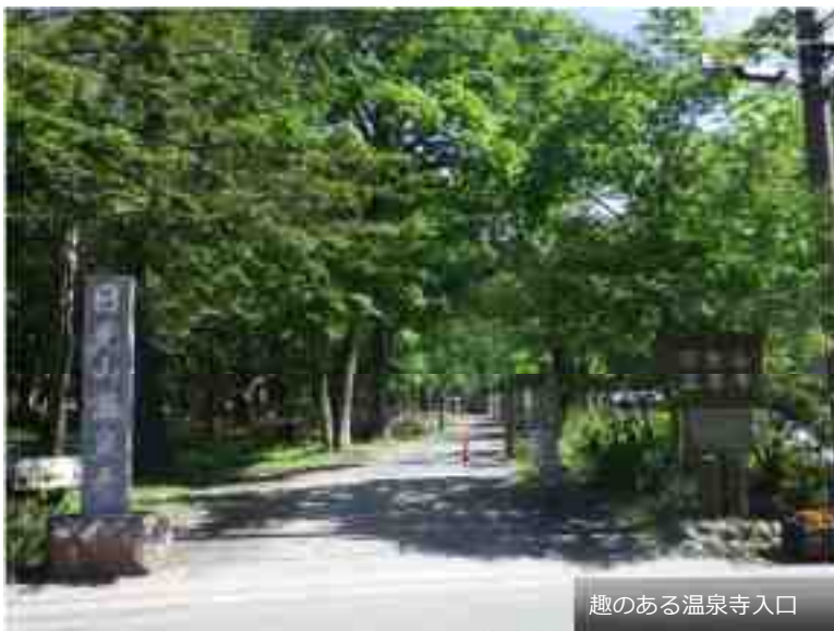
趣のある温泉寺入口

また、古い由来の伝わるこの温泉地の歴史、風土、文化等に関することについても、言い伝えられる事柄について、さらに調査研究を進め、その由緒を明らかにし、適切に周知、伝承していくこととする。