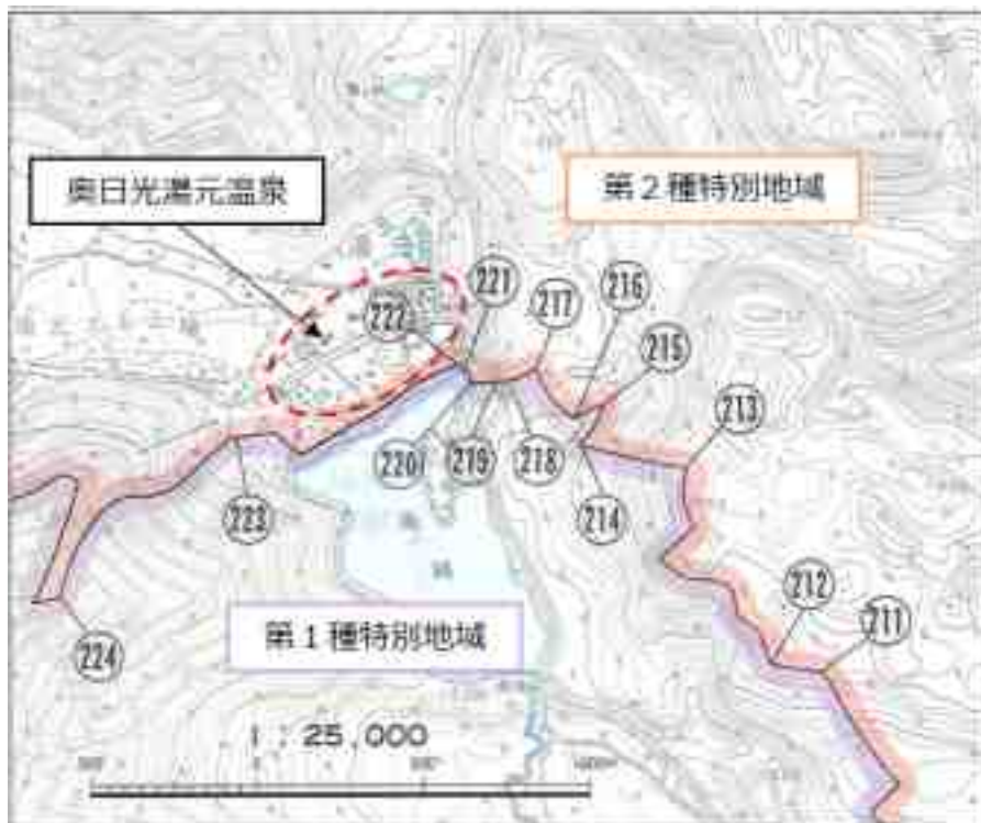
図 国立公園指定状況図

奥日光湯元温泉は、栃木県の北西部にあつて、群馬、栃木、福島の三県にまたがる日光国立公園の中心部、第2種特別地域内に位置している。南側を除く三方を白根山、温泉ヶ岳、三岳の山々に囲まれ、開けた南側はラムサール条約に登録された「奥日光の湿原」の1つ、湯ノ湖に面している。