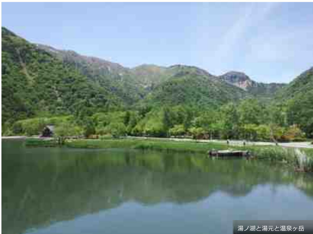
湯ノ湖と湯元と温泉ヶ岳