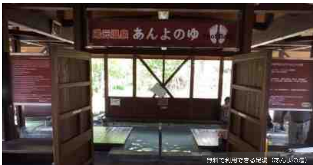
無料で利用できる足湯(あんよの湯)