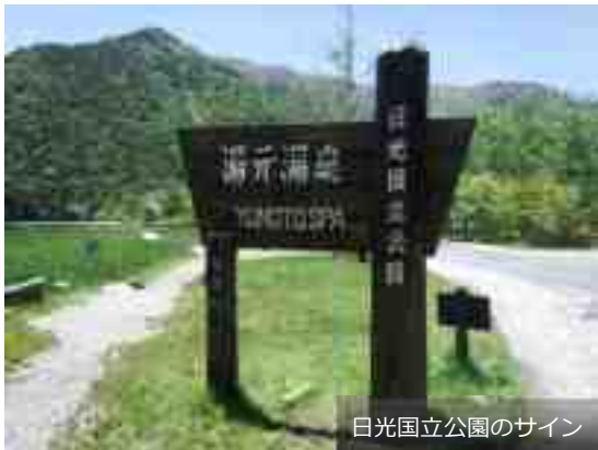
日光国立公園のサイン

当温泉地には、湯治場としての古き良き歴史や文化と、日光国立公園の中心にある恵まれた自然環境が共存している。同時に、これらが当温泉地の“宝”であり、これからも受け継がれていくべき“国民保養温泉地としての資質”であると考えている。