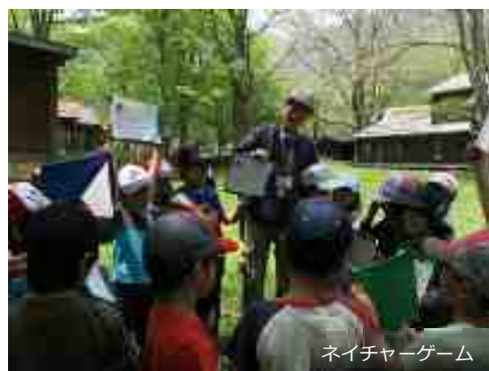
ネイチャーゲーム