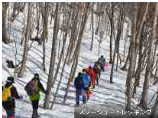
スノーシュートレッキング