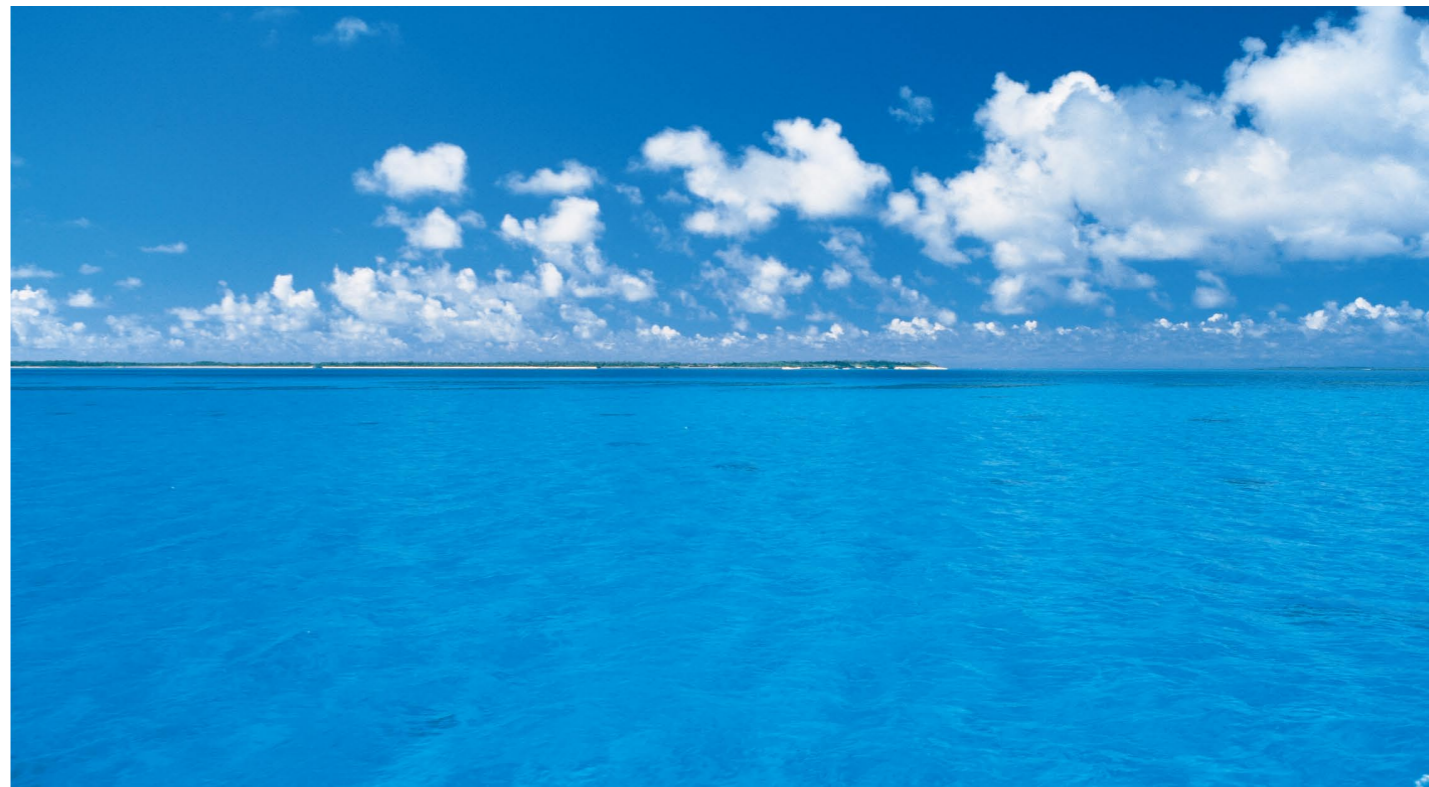
サンゴの海に浮かぶ八重山の島々(西表石垣国立公園)(5)