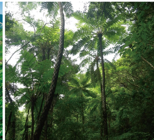
奄美大島の金作原(奄美群島国立公園)