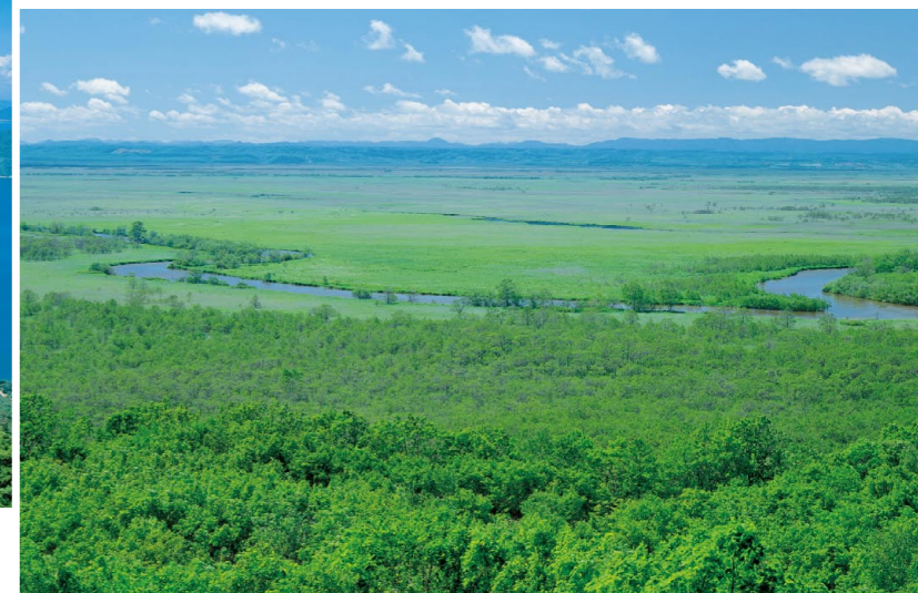
湿原を下る釧路川(釧路湿原国立公園)(4)