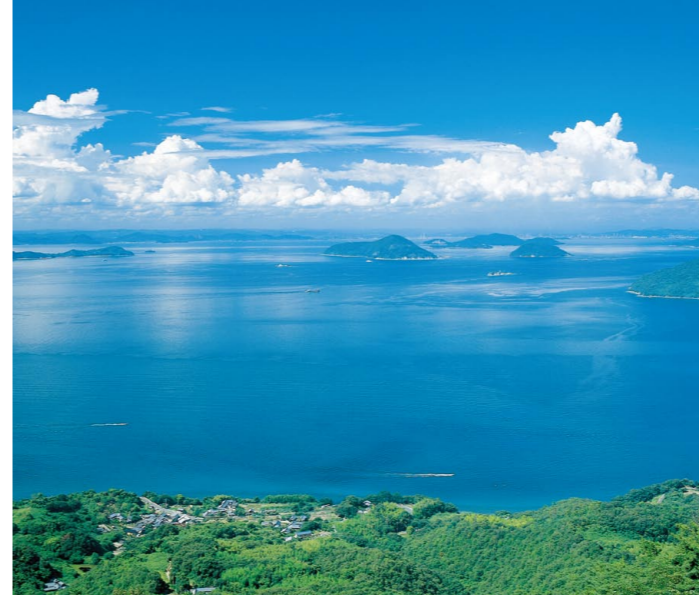
多島海の夏(瀬戸内海国立公園)(3)