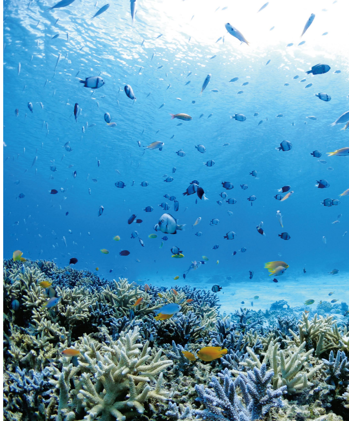
いのち育むケラマブルーの碧い海(慶良間諸島国立公園)(1)