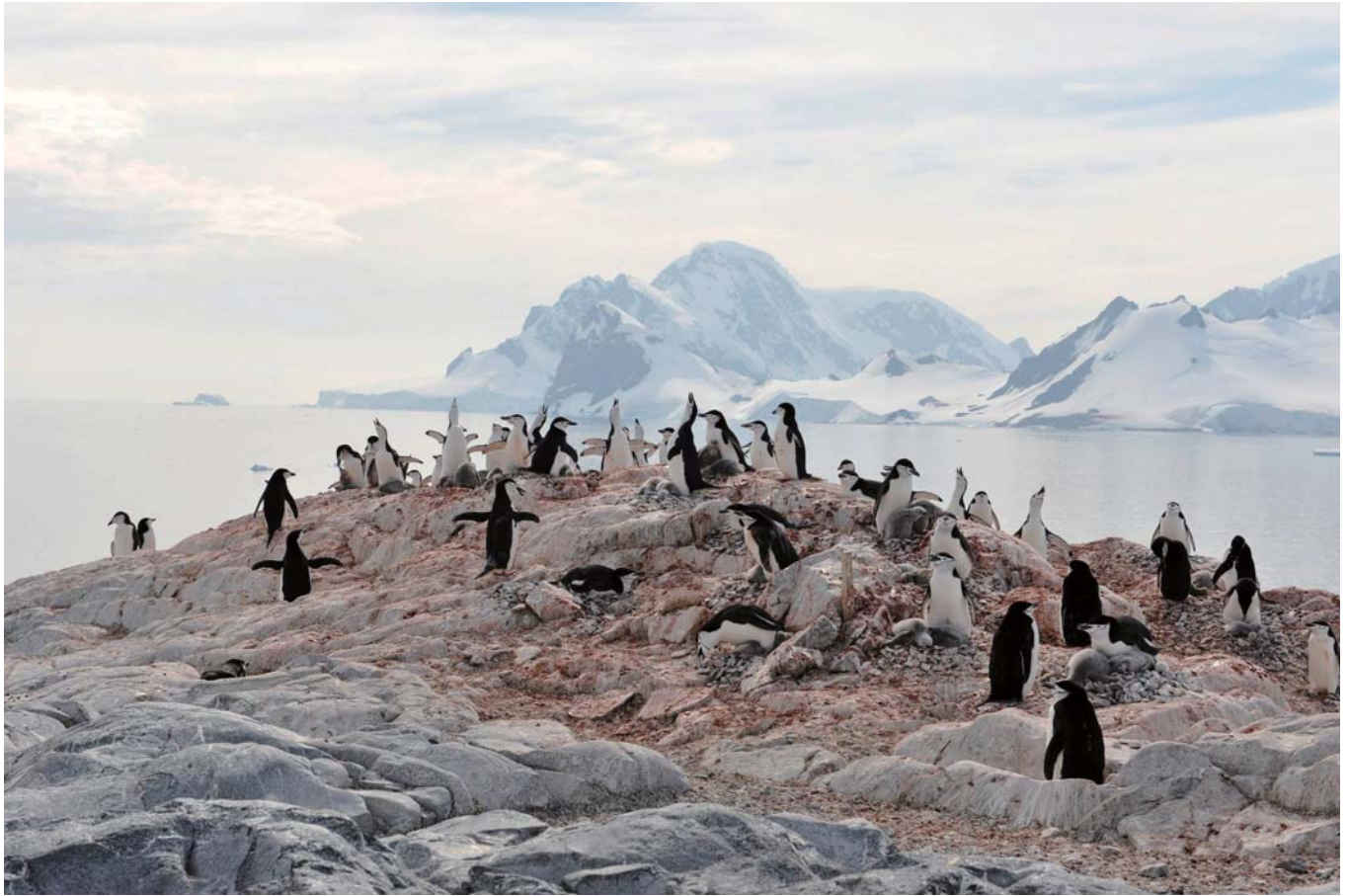
島には岩の露頭上にいくつかのヒゲペンギンのコロニーがある