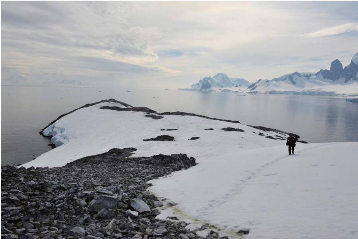
島の北東に向かって小さなチンストラップコロニーの光景