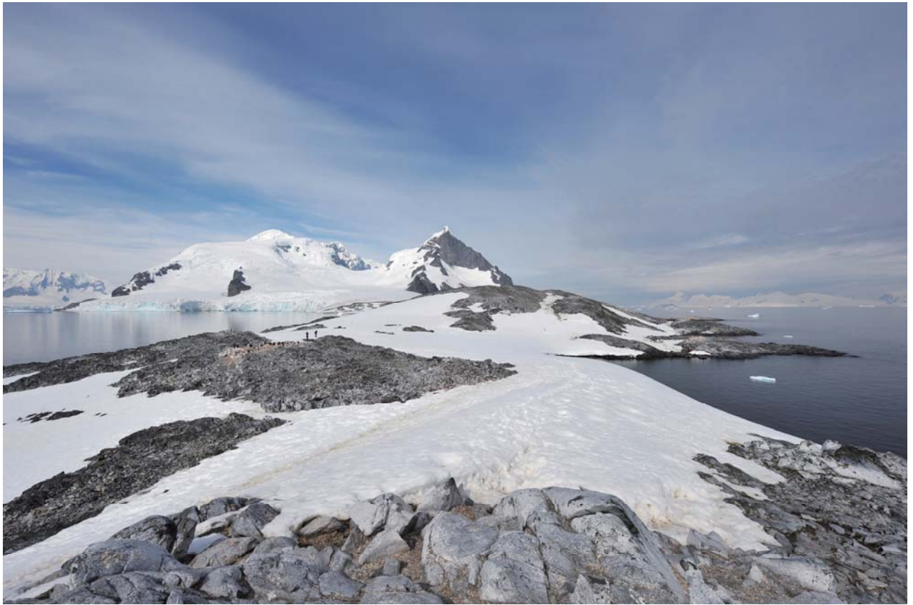
南西を見た際に右手側の岩場が好適な上陸エリア