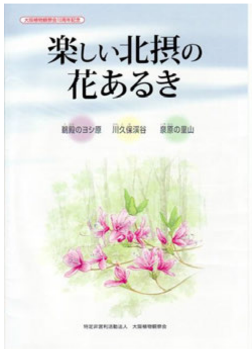
2012年3月発行10周年記念