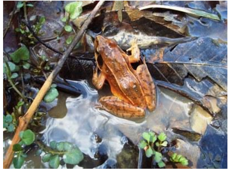
ニホンアカガエル