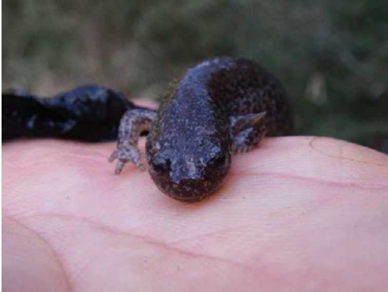
カスミサンショウウオ