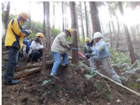
森林ボランティア 講師派遣