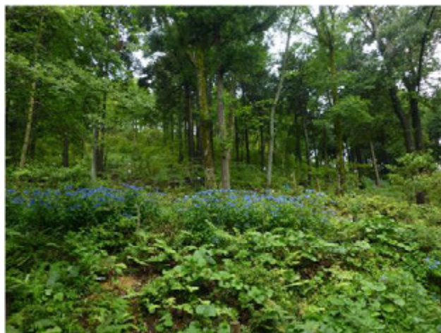
神峰山自然園維持管理