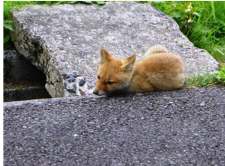
ホンドキツネ(子狐)