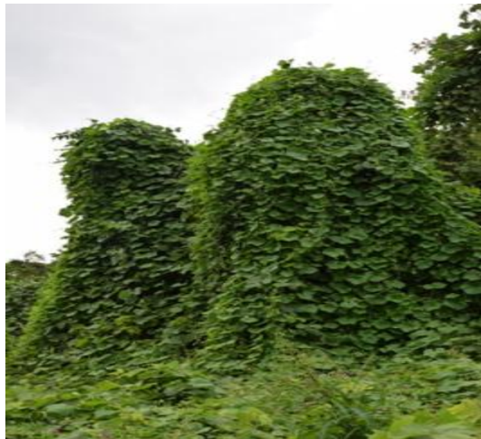
↑木に覆いかぶさるアレチウリ (原木が見えない・・・)