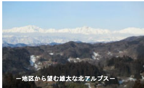
—地区から望む雄大な北アルプス—