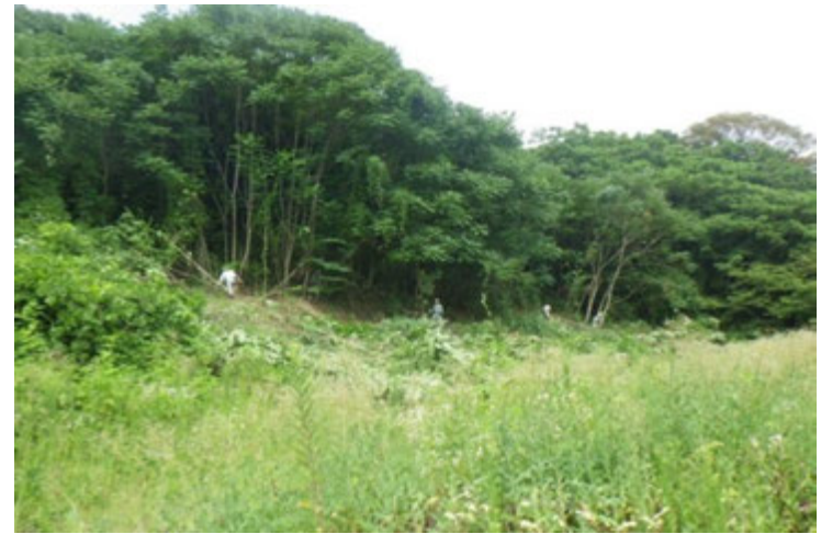
↑繁殖するニワウルシ (元、畑です・・・)