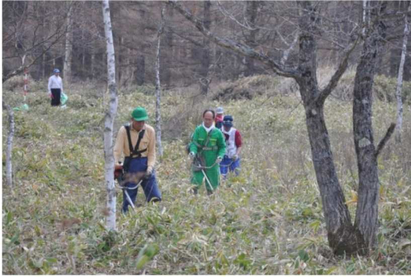
(植樹地支障物伐採)