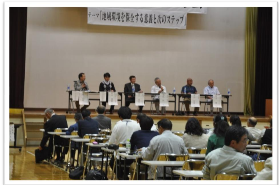
(摩周水環境フォーラム)