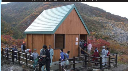
栗駒国定公園(岩手県)