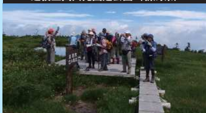
越後三山只見国定公園(新潟県)