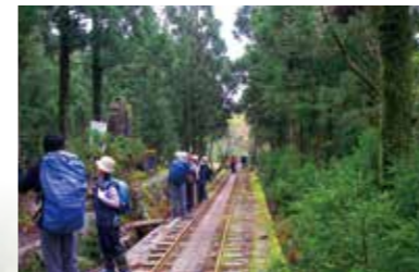
登山道に転用されたトロッコ道