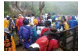
混雑時の縄文杉デッキ

平成元年に九州本土と屋久島をつなぐ高速船が就航した後、島への入込み客数は急増し、遺産登録後もその傾向が続きました。平成 12 年に約 16 万人であった登山者は、平成 23 年には約 27 万人に増加しました。特に縄文杉を目指す登山者は年間 9 万人前後にまで増え、登山道の荒廃が生じたため、環境省をはじめとする関係行政機関では、地元関係者の協力を得ながら、環境保全対策として登山道やトイレなどの施設整備、携帯トイレの導入、マイカー規制の実施と登山バスの運行などを行ってきました。また、平成 21 年には、屋久島町エコツーリズム推進協議会が発足し、山岳部に集中する利用の分散化を進める策として、島内の各集落に今も残る昔ながらの生活様式や伝統を体験するエコツアーの導入を推進するとともに、屋久島でエコツーリズムを実施する際の心得やルールをまとめた「屋久島ルール」の作成を進めています。