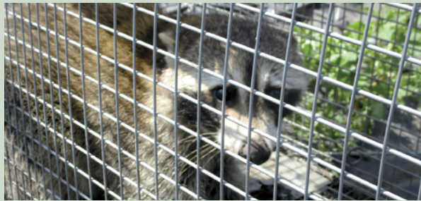
▲箱ワナで捕獲されたアライグマ★1