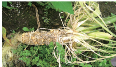
▲アライグマが実だけを食べた跡★3