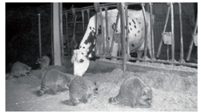
▲牛舎に集まったアライグマ★4