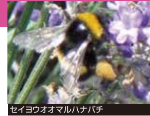
セイヨウオオマルハナバチ