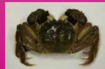
チュウゴクモクスガニ(上海ガニ)