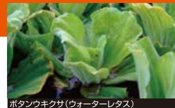
ポタンウキクサ(ウォーターレタス)