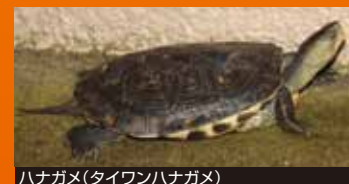
ハナガメ(台湾ハナガメ)