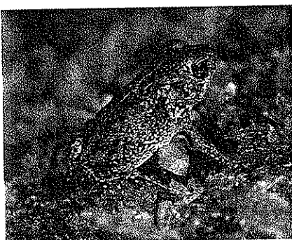
非常に小さな上陸したばかりの幼体