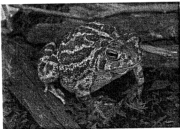
どっしりとした体型のボリュームあるヒキガエル。背の暗色の模様は左右対称