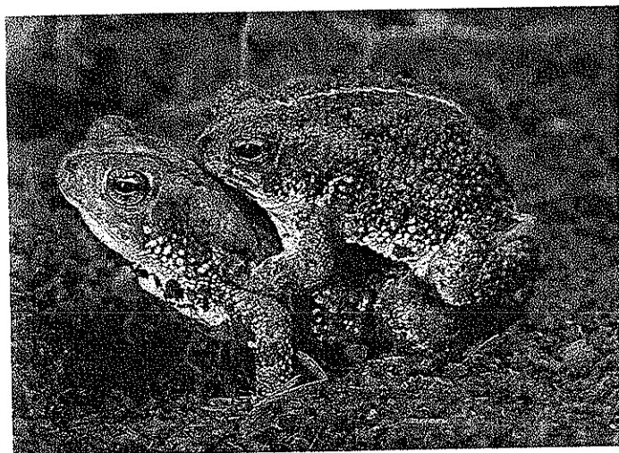
メスに包摂するオス。メスはオスよりもやや大きい