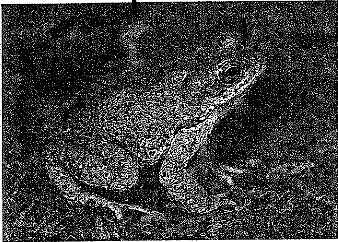
イボ状突起の先端が赤く、小さな赤斑に覆われているように見える