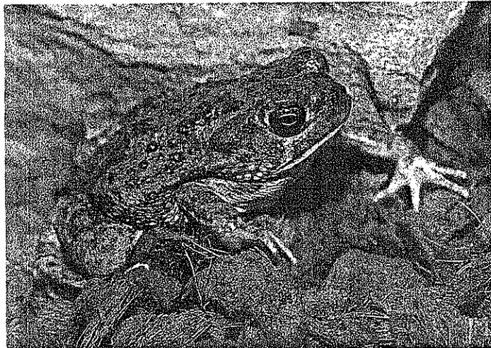
乾燥地を好む種で、地中によく潜る